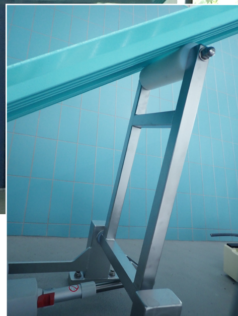
Sviktbräda lutningsvinkel 0 - 40°